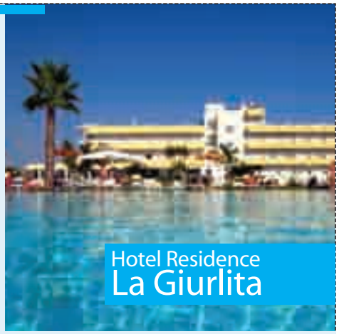
Hotel Residence La Giurlita

Marina di Ugento (LE) 0833.932405 www.lagiurlita.com