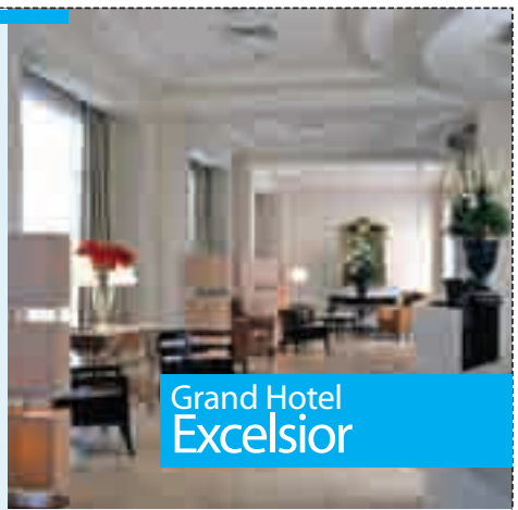
Grand Hotel Excelsior

Catania 095.7476111 www.hotelexcelsiorcatania.com