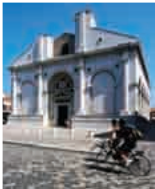
Nella vicina Torre del Lago Puccini si svolge fino al 22 agosto il 56° Festival Puccini. A Forte dei Marmi "Estate al Forte" è il cartellone delle manifestazioni che spaziano da concerti di musica a spettacoli di teatro e varietà, da fiabe per bambini a mostre.

T ra i diversi abbinamenti mare e divertimento uno dei più immediati è Rimini . Qui il calendario degli eventi estivi si compone di ben 700 appuntamenti tra spettacoli, passeggiate nella storia, mostre, eventi sportivi, sagre e un intero mese, luglio, dedicato ai più piccoli e alle loro famiglie. Alla prima edizione è il Riviera on air Festival con big della musica nella nuova arena 105 Stadium fino all'8 agosto. Altro abbinamento noto è la Versilia. A Viareggio nella Cittadella del Carnevale si tengono numerosi spettacoli e concerti, nonché laboratori per i bambini. Nella vicina Torre del Lago Puccini si svolge fino al 22 agosto il 56° Festival Puccini. A Forte dei Marmi "Estate al Forte" è il cartellone delle manifestazioni che spaziano da concerti di musica a spettacoli di teatro e varietà, da fiabe per bambini a mostre.