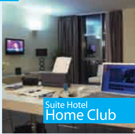
Suite Hotel Home Club

Struttura realizzata in ampio parco confinante con il litorale dello splendido e sabbioso mare Jonico-Salentino, immerso nella natura, offre qualità e comfort eccellenti. Si compone di appartamenti a schiera al piano terra e primo piano destinati alla formula residence e di un corpo alberghiero a più piani per la formula hotel. Ampi spazi comuni e servizi di buon livello. A 110 km dall'aeroporto di Brindisi.