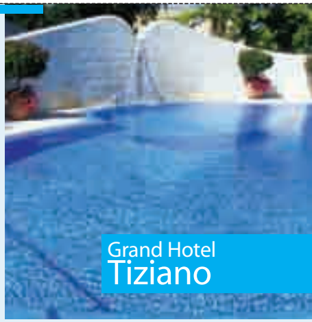
Grand Hotel Tiziano

Lecce 0832.272111 www.grandhoteltiziano.it