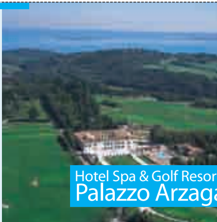
Hotel Spa & Golf Resort Palazzo Arzaga

Palazzo Arzaga vi accoglie in uno dei più prestigiosi Leading Golf Resort d'Europa. I due campi da golf, firmati da celebri Pro, hanno uno standard di livello internazionale: il percorso di 18 buche par 72 di Jack Nicklaus II e il 9 buche par 36 di Gary Player. La Spa, con trattamenti Clarins e personalizzati, è il miglior modo per finire la giornata e rendere l'esperienza Arzaga indimenticabile.