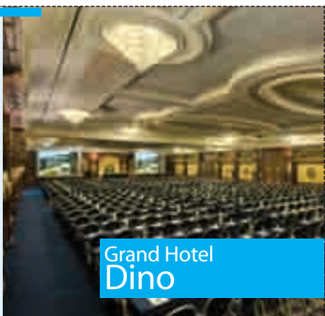
Grand Hotel Dino

Affacciato sulle rive del Lago Maggiore, il Grand Hotel Dino di Baveno è dotato di 383 camere e suite arredate con tutti i comfort. Per il benessere e relax è a disposizione il modernissimo e tecnologico 'Dino Health Club' con palestra, sauna, bagno turco, piscina interna, vasche idromassaggio e piscina esterna. Il Centro Congressi offre 34 sale riunioni da 20 a 1200 posti, tra cui la nuova Ballroom Carlo.