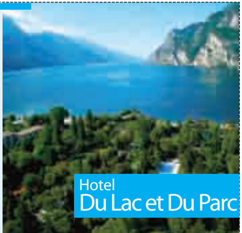
Hotel Du Lac et Du Parc

A Riva del Garda, immerso in un parco di 7 ettari affacciato sul lago, sorge il Du Lac et Du Parc Grand Resort. 159 camere, 67 suites e 33 bungalows, diversi bar e ristoranti, campi da tennis, piscine indoor e all'aperto, club nautico, palestra con area wellness, Spa&Fitness, sale congressi e un impeccabile servizio fanno della struttura una location meravigliosa per vacanze o per incontri di lavoro.