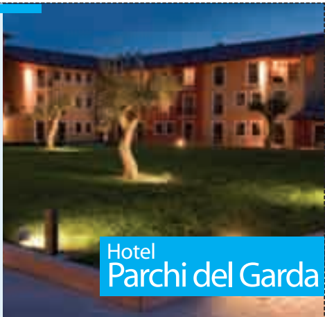
Hotel Parchi del Garda

Nell'aprile del 2010 ha aperto le porte l'Hotel Parchi del Garda, 4 stelle circondato dalla favolosa cornice naturale del lago di Garda. Disposto su 5 padiglioni, l'hotel dispone di 218 camere di varia tipologia e di 15 suite. Innovativa l'offerta congressuale: grazie al forte legame commerciale con i parchi tematici partners della zona può proporre un'ampia gamma di attività pre e post congressuali.